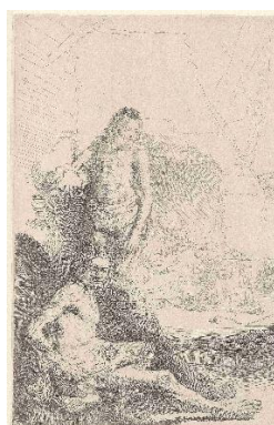
Rembrandt Harmensz. van Rijn, Der Laufwagen, Entwurf: um 1646