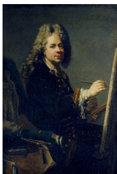
Jacques van Schuppen, Selbstbildnis vor der Staffelei , 1718 © Gemäldegalerie der Akademie der bildenden Künste Wien