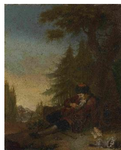
Januarius Zick, Rousseaus Erweckungserlebnis beim Lesen einer Preisaufgabe , 1757 © Museum zu Allerheiligen Schaffhausen, Foto: Jürg Fausch