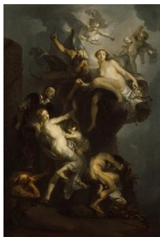
Franz Anton Maulbertsch, Allegorie auf das Schicksal der Kunst , um 1770 © Gemäldegalerie der Akademie der bildenden Künste Wien