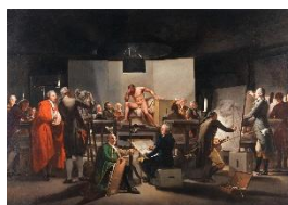
Martin Ferdinand Quadal, Der Aktsaal der Wiener Akademie im St. Anna Gebäude , 1787 © Gemäldegalerie der Akademie der bildenden Künste Wien